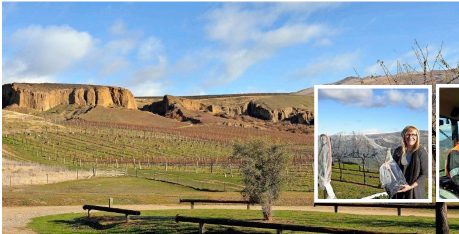
André Lategan inspiziert die Reben des Weinguts Amisfield, auf dem er für den Weinbau verantwortlich ist (Bild links oben). Im Keller von Gibbston Vallley Wines reifen die Weine in französischen Barriques (Bild links unten). Die Reben von Cloudy Bay erstrecken sich am Fuß von Hügeln, an denen Goldsucher aus früheren Zeiten deutliche Spuren hinterlassen haben (Panorama).